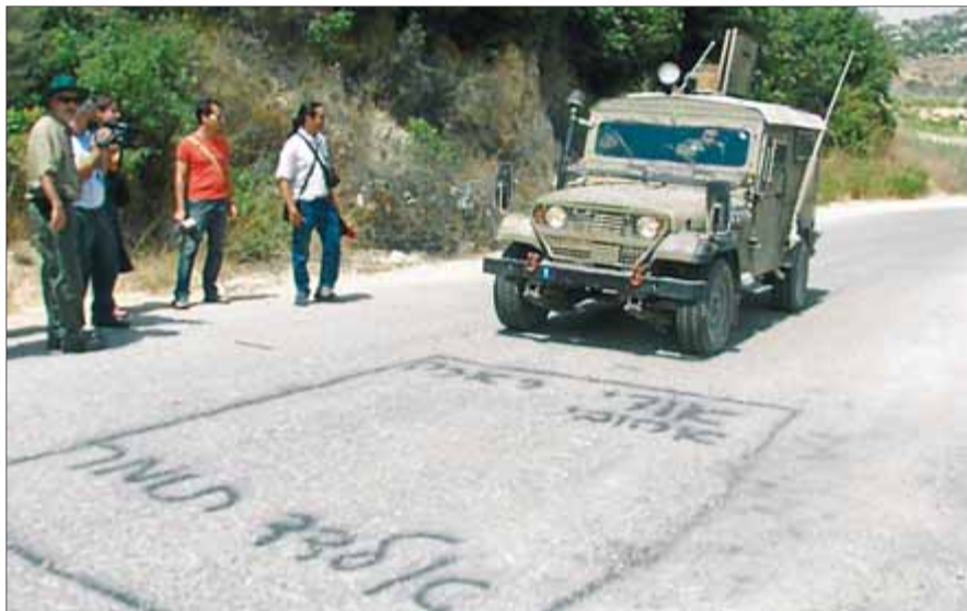
El rectangle que recorda el lloc on va ser atacada la patrulla israeliana fa 13 mesos ■ J. BERIS